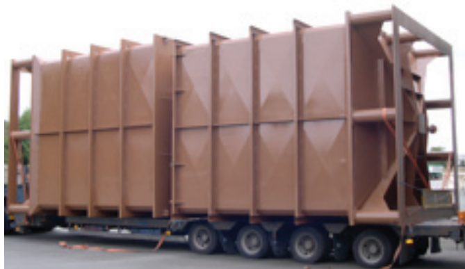
Station d'expédition vrac