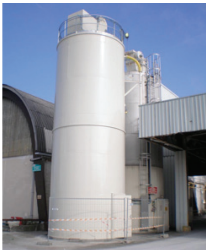
Silo rond monobloc sur jupe