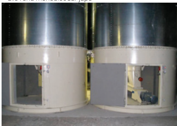
Silos ronds à fond plat avec extracteur planétaire